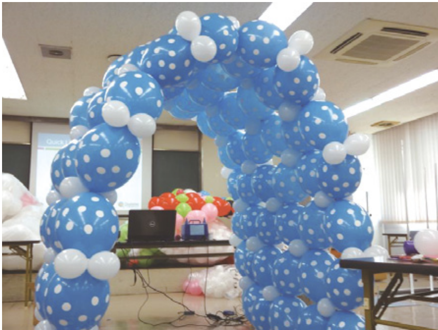
あっという間にトンネルアーチが完成！ 箇所に2個組を入れるのがポイントです。