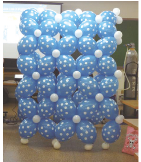
横から見た図。 ウォールとしても使えます。