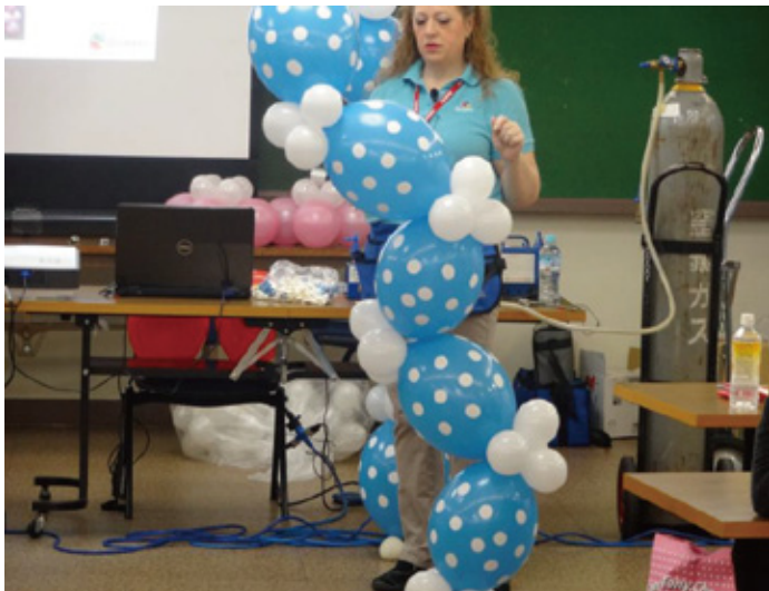
このように3個組を入れ込むと ジグザクのラインも可能！