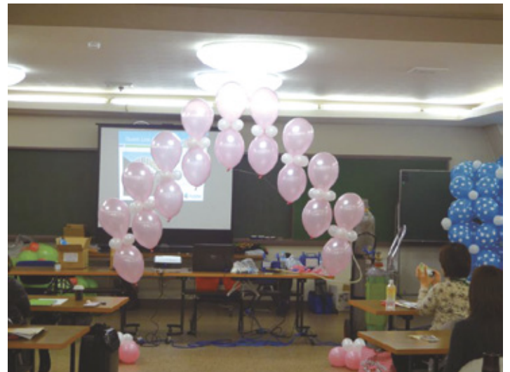
このような変わったアーチも工夫ひとつで 簡単に使えるのもクイックリンクの魅力です。