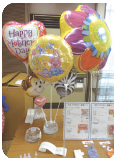
プレミアムアクセサリーの スタンド什器