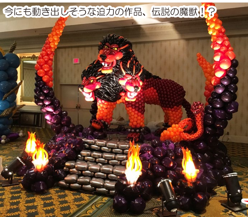
今にも動き出しそうな迫力の作品、伝説の魔獣!?