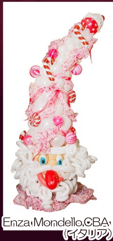
Enza Mondello, CBA (イタリア)