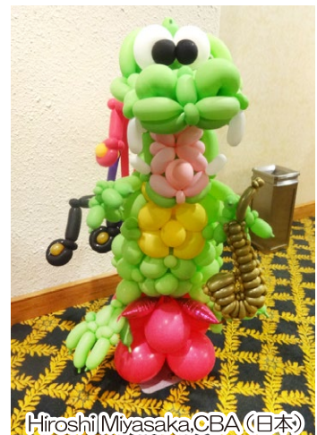
マルディグラを象徴するオブジェ