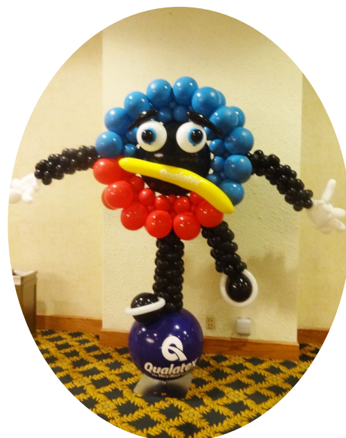
当イベントではすっかりお馴染みになったパイオニア社のキャラクター キューズくん