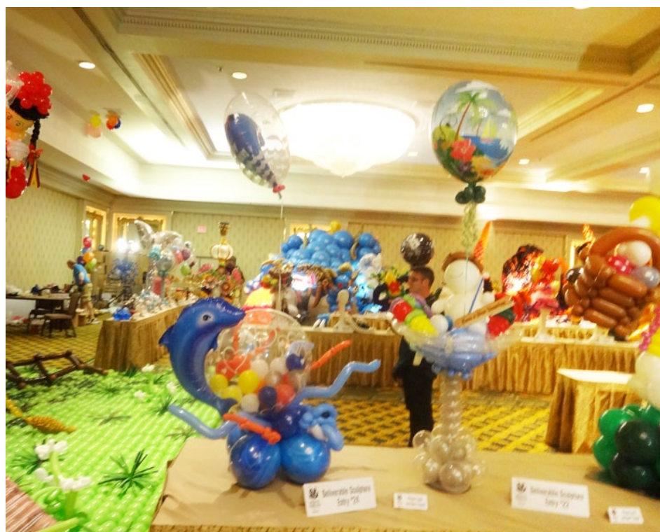
写真では収めきれない、たくさんの作品が並ぶコンペティション会場