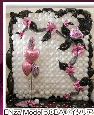
Enza Mondello, CBA (イタリア)