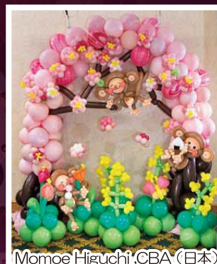
Momoe Higuchi, CBA (日本)