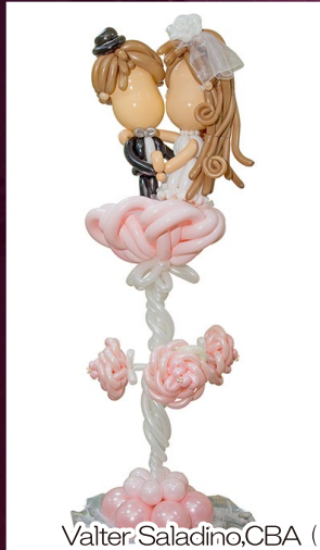
Valter Saladino, CBA (イタリア)