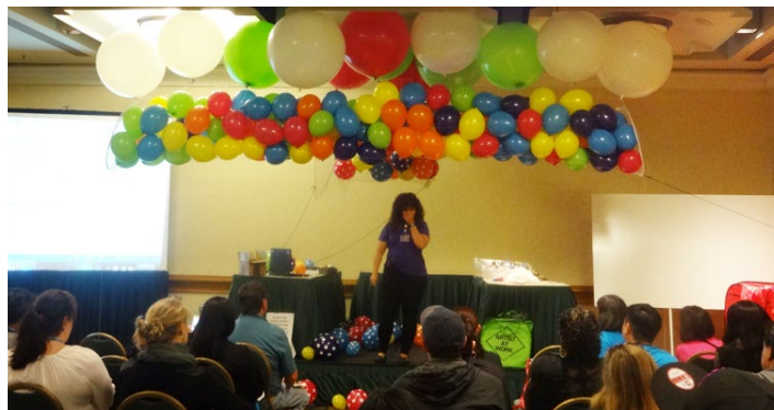
ウィンドウディスプレイクラス