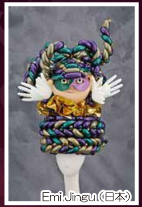
Emi Jingu (日本)