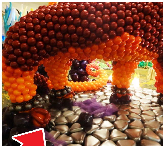
近くで見るとさらに迫力が倍増! 細部に渡る精巧な作りにも圧巻!